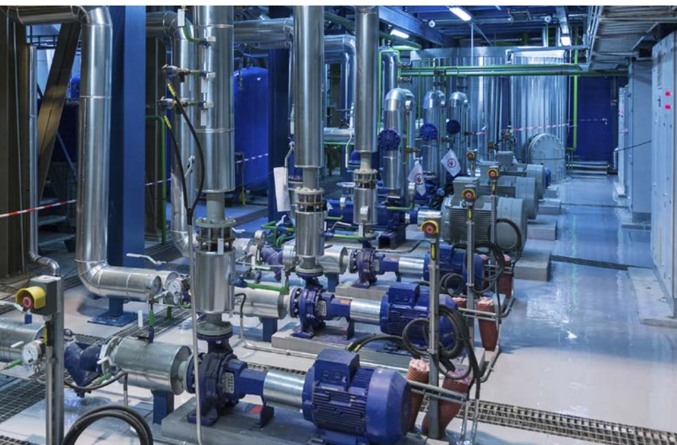
Применение для насосов (например, экономия энергии в автоматике зданий с преобразователями частоты)