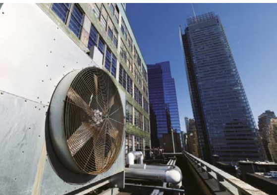
Применение преобразователей частоты для привода вентиляторов приносит выгоду