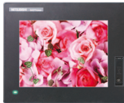
Наслаждайтесь ярким TFT дисплеем GT14 с 65536 цветами и светодиодной подсветкой

Обладая штатной встроенной памятью, расширенной до 9 Мб, GT14 сохраняет до 2.000 точек данных; помимо этого, SD карты и USB накопители обеспечивают дополнительную память для хранения или переноса данных. Кроме того, для увеличения гибкости GT14 позволяет регистрировать данные нескольких удаленных устройств, например, ПЛК и регуляторов температуры. В перечень дополнительных функций также входит контроль и мониторинг до двух каналов устройств промышленной автоматизации, подключенных к GT14 через последовательный порт или по Ethernet. Например, к одному каналу вы можете подключить ПЛК с сервоусилителем, а к другому – преобразователь частоты или регулятор температуры, и затем поочередно работать с ними, контролируя оба устройства.