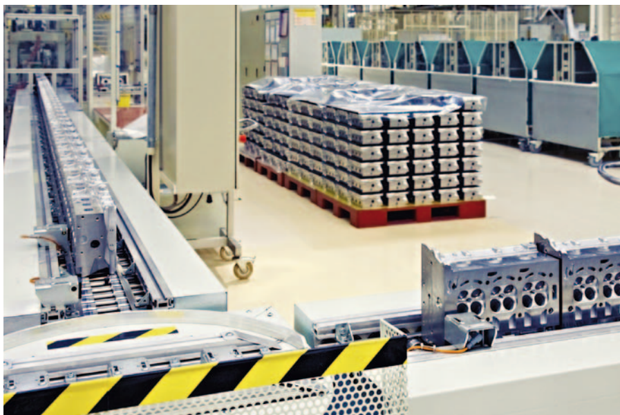
Проверка модификаций без прерывания производства

Линейка GT14 – новейшее пополнение серии графических панелей оператора GOT1000, определяющее новые стандарты производительности для панелей среднего класса с диагональю 5.7", устанавливаемых в пульты и шкафы управления. Обладая всеми функциями, обеспечившими популярность интерфейсов человек-машина от Mitsubishi Electric, и ценой, делающей их одними из самых экономичных на рынке, эти новые панели оператора предлагают множество новых возможностей и преимуществ, включая слот для внешней SD карты, порты USB, опции связи по Ethernet, TFT дисплей с 65536 цветами, светодиодную подсветку и аналоговые сенсорные функции.